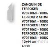
ZANQUÍN DE FERROKER V7071060 - 100027325 FERROKER ALUMINIO V7071061 - 100027328 FERROKER LATÓN V7071062 - 100027331 FERROKER CALDERA V7071063 - 100027334 10x44 cm 4"x17 1/8" G130