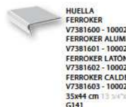
HUELLA FERROKER V7381600 - 100027910 FERROKER ALUMINIO V7381601 - 100027913 FERROKER LATÓN V7381602 - 100027916 FERROKER CALDERA V7381603 - 100027919 35x44 cm 13 5/8"x17 1/8" G141