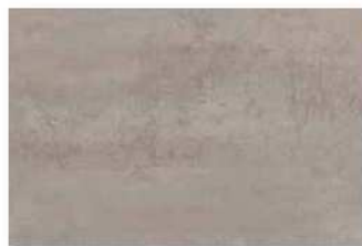
FERROKER ALUMINIO V5621701 100026606 44x66 cm (x10.1 mm) 17 3/8"x26" Gres Porcelánico Porcelain tile V3 G112 gris