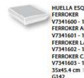
HUELLA ESQUINA DE FERROKER V7341600 - 100027760 FERROKER ALUMINIO V7341601 - 100027763 FERROKER LATÓN V7341602 - 100027766 FERROKER CALDERA V7341603 - 100027769 35x45.4 cm 13 5/8"x17 1/8" G142