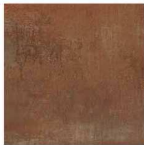
FERROKER CALDERA V5590579 100088317 59.6x59.6 cm (x10.5 mm) 23 1/2"x23 1/2" Gres Porcelánico Porcelain tile V3 G113 marón