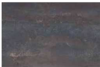
FERROKER V5621700 100026602 44x66 cm (x10.1 mm) 17 3/8"x26" Gres Porcelánico Porcelain tile V3 G112 antiscayado