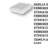
HUELLA ESQUINA IZ FERROKER V7341610 - 100027772 FERROKER ALUMINIO V7341611 - 100027775 FERROKER LATÓN V7341612 - 100027778 FERROKER CALDERA V7341613 - 100027781 35x45.4 cm 13 5/8"x17 1/8" G142