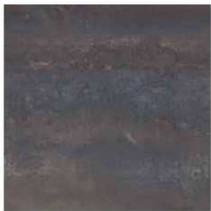
FERROKER V5590578 100088302 59.6x59.6 cm (x10.5 mm) 23 1/2"x23 1/2" Gres Porcelánico Porcelain tile V3 G113 antiscayado