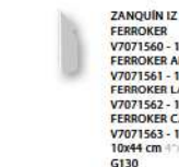
ZANQUÍN IZ FERROKER V7071560 - 100027391 FERROKER ALUMINIO V7071561 - 100027394 FERROKER LATÓN V7071562 - 100027397 FERROKER CALDERA V7071563 - 100027400 10x44 cm 4"x17 1/8" G130