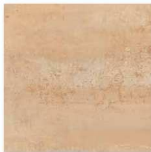
FERROKER LATÓN V5590580 100088319 59.6x59.6 cm (x10.5 mm) 23 1/2"x23 1/2" Gres Porcelánico Porcelain tile V3 G113 beige