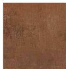
FERROKER CALDERA V2449931 100088316 44.3x44.3 cm (x10.0 mm) 17 1/2"x17 1/2" Gres Porcelánico Porcelain tile V3 G44 café