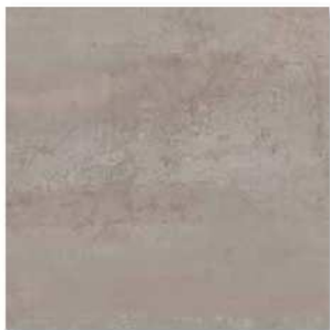
FERROKER ALUMINIO V5590577 100088303 59.6x59.6 cm (x10.5 mm) 23 1/2"x23 1/2" Gres Porcelánico Porcelain tile V3 G113 gris