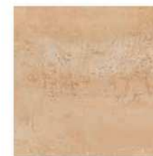
FERROKER LATÓN V2449932 100088318 44.3x44.3 cm (x10.0 mm) 17 1/2"x17 1/2" Gres Porcelánico Porcelain tile V3 G44 beige