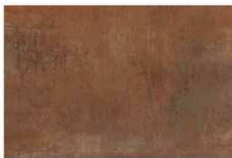
FERROKER CALDERA V5621703 100026614 44x66 cm (x10.1 mm) 17 3/8"x26" Gres Porcelánico Porcelain tile V3 G112 marón