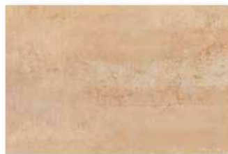
FERROKER LATÓN V5621702 100026610 44x66 cm (x10.1 mm) 17 3/8"x26" Gres Porcelánico Porcelain tile V3 G112 beige