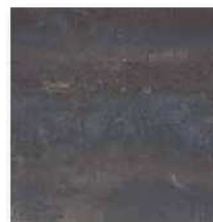
FERROKER V2249923 100046033 44.3x44.3 cm (x10.0 mm) 17 1/2"x17 1/2" Gres Porcelánico Porcelain tile V3 G44 antiscayado