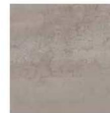
FERROKER ALUMINIO V2449928 100088015 44.3x44.3 cm (x10.0 mm) 17 1/2"x17 1/2" Gres Porcelánico Porcelain tile V3 G44 gris