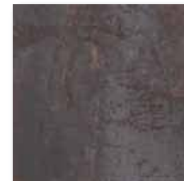
Ferro V2311900 - 100021684

33.3x33.3 cm (x9.5 mm) 13"x13" Gres porcelánico Porcelain tile V3 G106