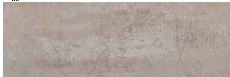
Ruggine Aluminio V1389880 - 100079334