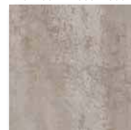
Ferro Aluminio V2311901 - 100021688