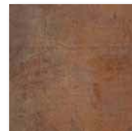
Ferro Caldera V2311903 - 100021696