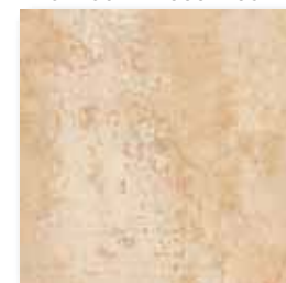
Ferro Latón V2311902 - 100021692