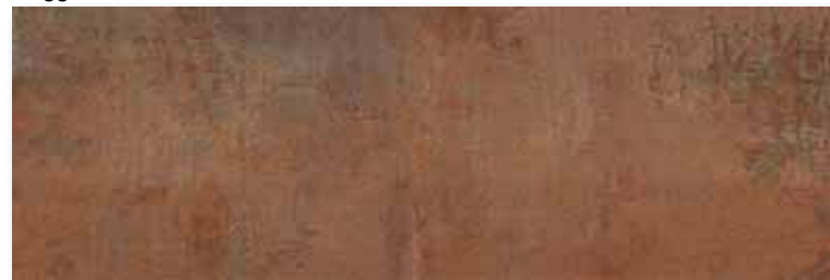
Ruggine Caldera V1389855 - 100080994