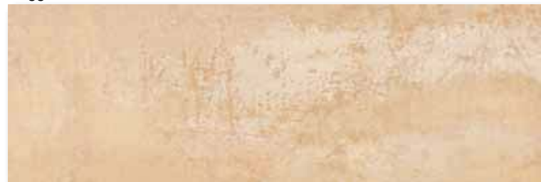
Ruggine Latón V1389851 - 100081043