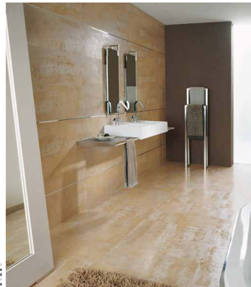
Pared Wall Ruggine Latón 33.3x100 cm Perfil Pro-Part Latón Cromado 12.5x8 mm (Butech) Suelo Floor Ferro Latón 33.3x33.3 cm